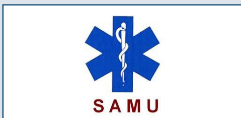
Urgences : 15 ou 112