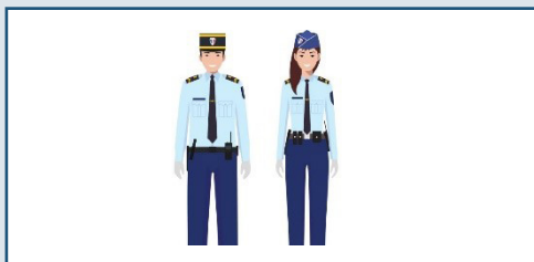
Gendarmerie : 17