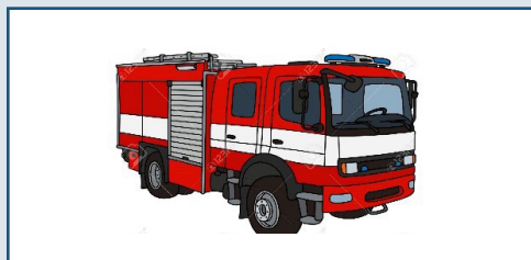
Pompiers : 18 ou 112