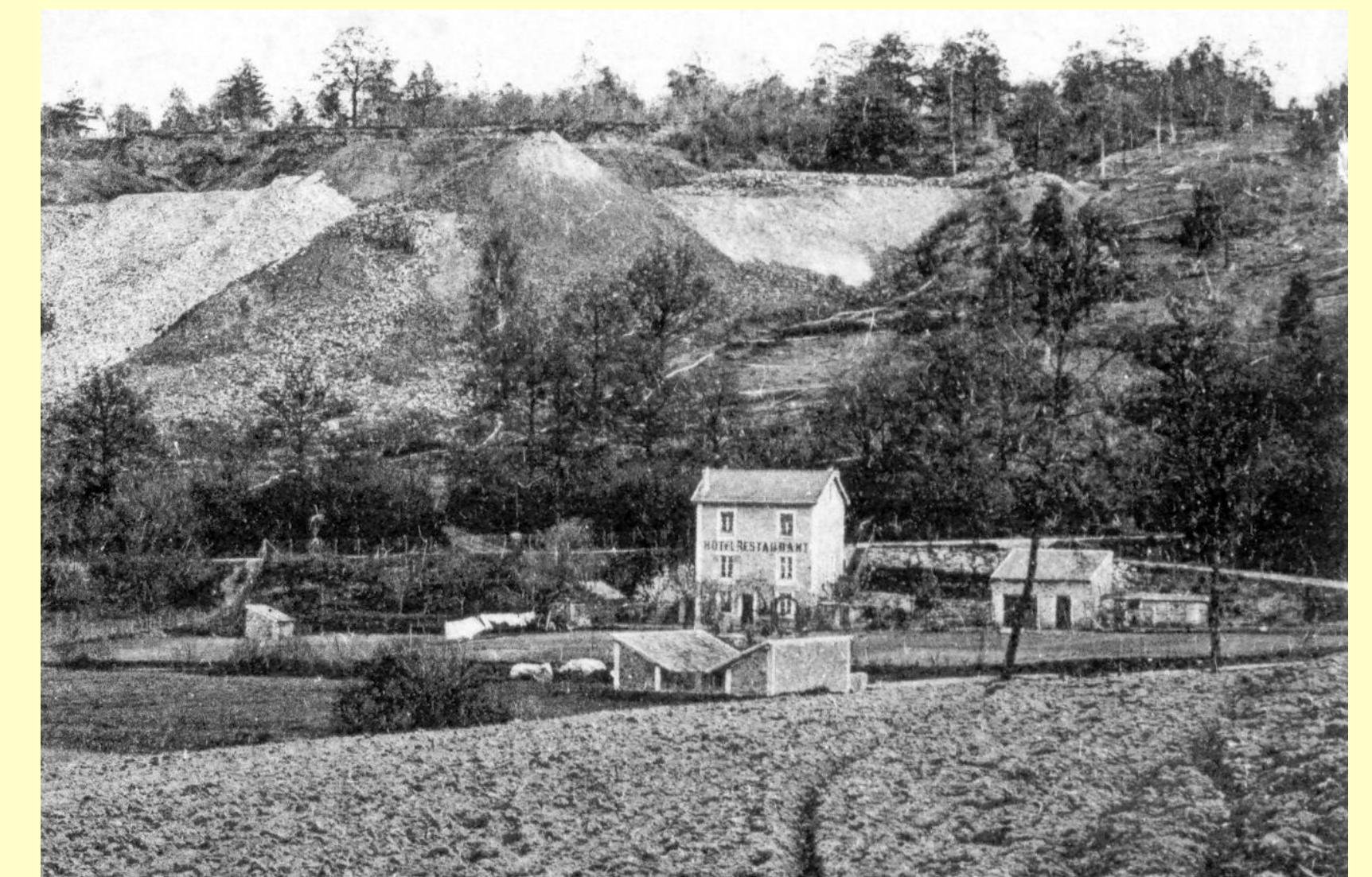
Entre la maison et la colline on voit la route des Molières à Saint-Rémy-les-Chevreuse