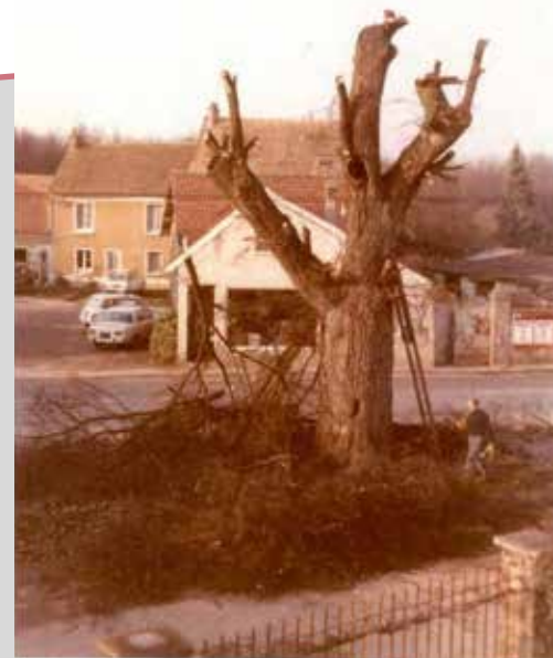
Les MOLIÈRES – Vallée de CHEVREUSE- Abattage en Novembre 1970 de l'ORME, arbre de la Liberté, planté en 1793.

Dans la foulée tu avais organisé toi-même une exposition et convié les enfants de l'école pour leur parler du village. Leur faire comprendre aussi qu'ils sont les membres d'une communauté, qu'un lien se construit entre les âmes d'un village et d'un pays.