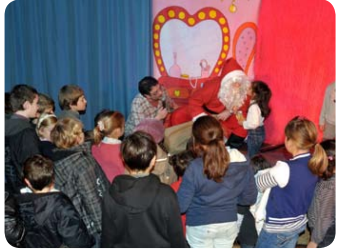
Le Noël des enfants le 18/12/2011, spectacle et goûter offerts et organisés par Les Molières Événements