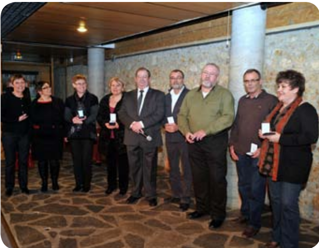
Voeux à la population le 21/01/2012, avec remise de médailles aux employés communaux.