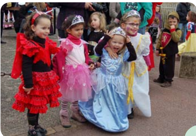
Carnaval des enfants le 10/03/2012, organisé par Les Molières Événements