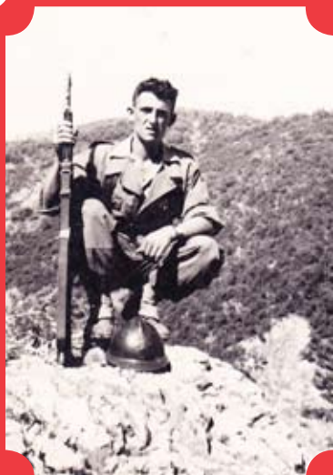
Maurice AUDIN Tué en Algérie le 9 Juillet 1957 à Chréa, piton de l'Atlas Blidéen qui domine Blida. La photo est prise sur ce piton.