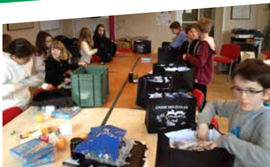
Dans le cadre des NAP, les enfants ont participé à la préparation des lots