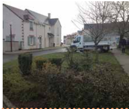
.....Espaces Verts rue des Bergeries

Restaurant LE CHAT BOTTÉ Crêperie – Grill – Plats variés