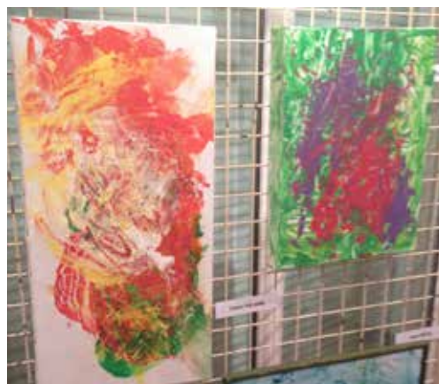
14 mars : Les Tout-Petits, art-thérapie - Expo à la maison de la CCPL, lancement du Méli-Mélo