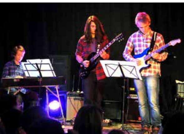
Samedi 15 mars : Soirée d'Artistes - Sports & Loisirs des Molières