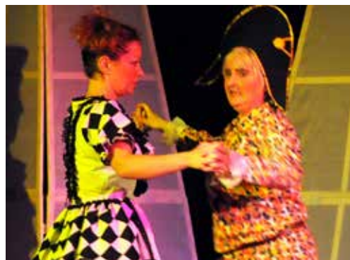
Dimanche 9 mars : Théâtre - Charivari chez Goldoni par la troupe des Amuse-gueules