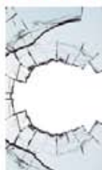
Vitre et miroir cassé